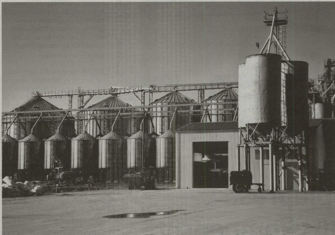
BAUSKAS PUSĒ strādā lauksaimniecības pakalpojumu kooperatīvā sabiedrība «Saimnieks-V». Attēlā – sabiedrības graudu pirmapstrādes komplekss.